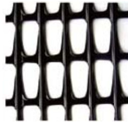
HG-100, 120, 150, 200