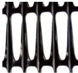
HG-36, 50, 60, 80