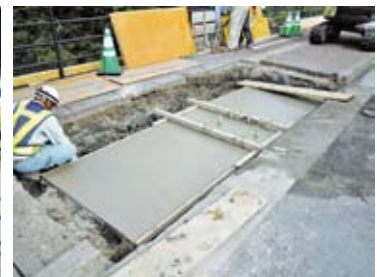
⑥所定高さまで打設。埋戻し・養生。