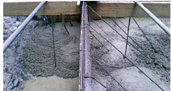
生コンは交互に打設。 生コン圧を打ち消しあい、補強を最低限に抑えます。