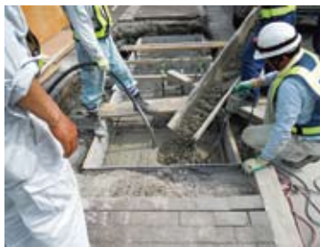
⑤生コン打設。周辺埋戻し。