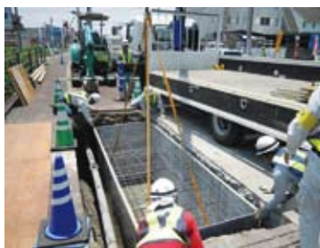
②KCスタンドフォーム据付け