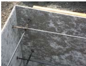
④コンクリート付着面加湿

製品が乾燥していると、生コンの水分を吸水してしまい十分な付着が得られない場合があります。