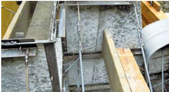
型組状況 支保材はアングル(既製品)を使用。 背面のサポート筋と溶接して固定。

○従来の合材を使用する工法のように左右別々に構築していくのではなく、1段ずつ同時に打ち上げて工期を短縮。