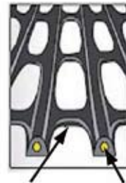
高密度ポリエチレン アラミド繊維(テクノラ®)

建設技術審査証明 (土木系材料・製品 技術、道路保全技術) (一財)土木研究センター 建技審証第0804号 (有効期限:2023.8.10) ※本審査証明は 前田工織株式会社 帝人株式会社に 交付されたものです。