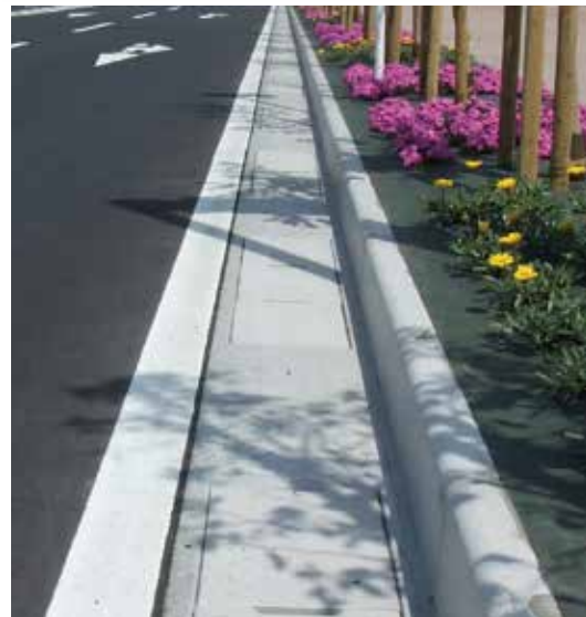
排水性舗装対応型