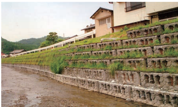
カゴボックス多段積みタイプ道路使用例