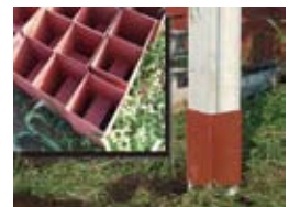
継ぎ手ジョイント