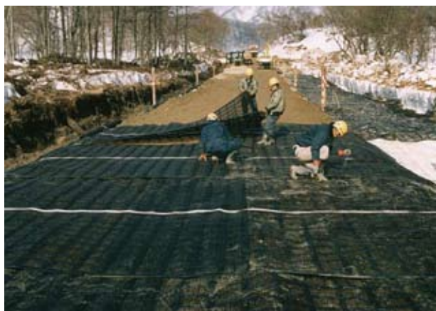
軟弱地盤において不同沈下を防ぐ