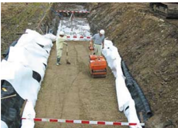
不織布との併用で中詰め材の適用範囲を拡大