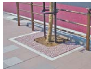
●オーダーパターン 地域、環境に合わせたオリジナルデザインをご提案します。 写真は国道3号鹿児島市伊敷(薩摩切子をモチーフとしています)