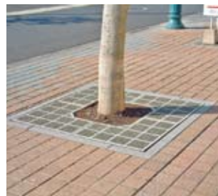
■SQT(正方形・透水)タイプ