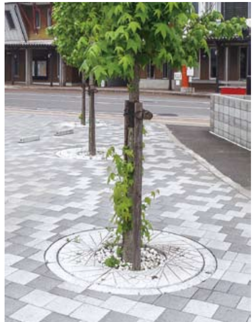
■CI(円形)タイプ：熊本県球磨郡あさぎり町

メンテナンスが植栽帯よりも容易なため、管理費のコストダウンが望めます。施工においても、作業時間が大幅に短縮できます。