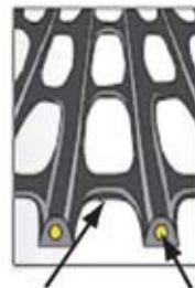
高密度ポリエチレン アラミド繊維(テクノラ®)

建設技術審査証明 (土木系材料・製品 技術、道路保全技術) (一財)土木研究センター 建技審証第0804号 (有効期限:2028.8.10) ※本審査証明は 前田工織株式会社 帝人株式会社 に交付されたものです。