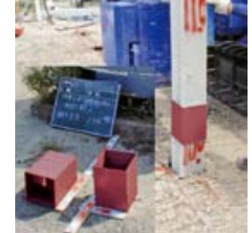
材料:継手ジョイント