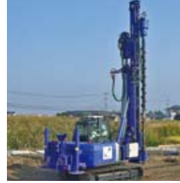
施工機械 リーダー式打設機