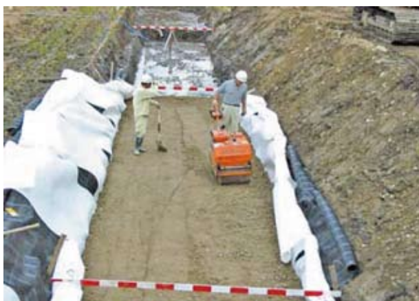
不織布との併用で中詰め材の適用範囲を拡大