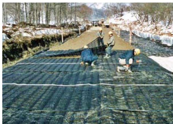
軟弱地盤において不同沈下を防ぐ