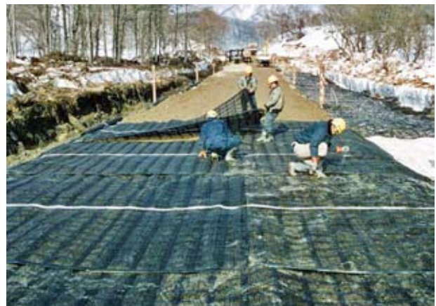
軟弱地盤において不同沈下を防ぐ