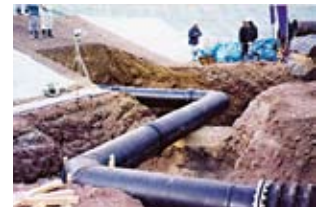
▲産業廃棄物処理場