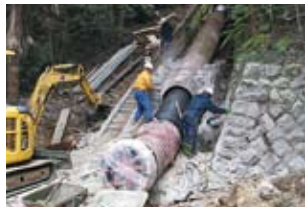
▲水力発電管路(水圧管)