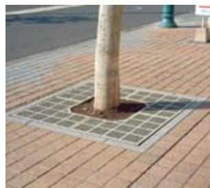
■SQT(正方形・透水)タイプ