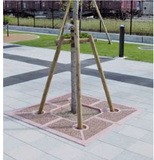
■SQT(正方形・透水タイプ)

メンテナンスが植栽帯よりも容易なため、管理費のコストダウンが望めます。施工においても、作業時間が大幅に短縮できます。