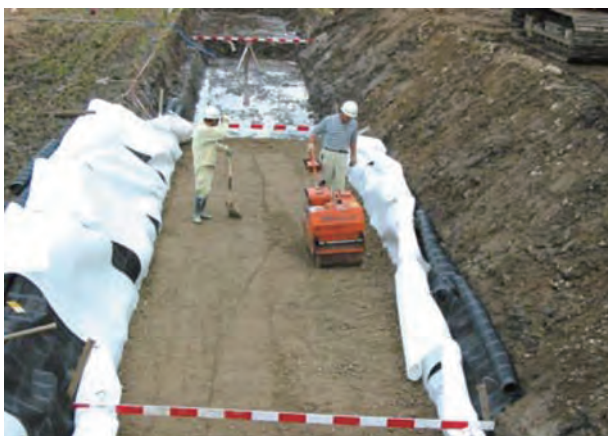
不織布との併用で中詰め材の適用範囲を拡大