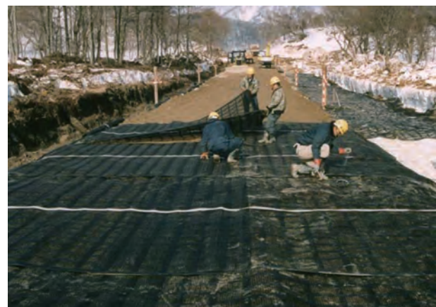
軟弱地盤において不同沈下を防ぐ