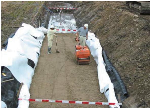
▲不織布との併用で中詰め材の適用範囲を拡大