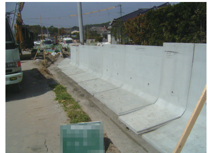
▲L型擁壁の基礎地盤補強の採用事例。農耕地に隣接しているため、コンクリートによる地盤改良が行えず、周囲の環境に影響を与えないジオグリッドを用いた「マットレス工法」が採用になりました。