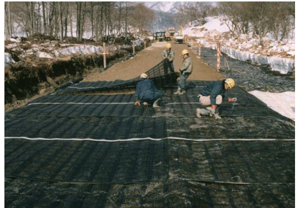
▲軟弱地盤において不同沈下を防ぐ