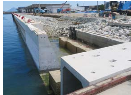
鹿児島県枕崎市:枕崎漁港 ボックスカルバート↑

建設技術審査証明では上記4性能のうち「塩化物イオン浸透抵抗性」について審査・証明されました。