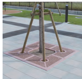
■SQT(正方形・透水)タイプ