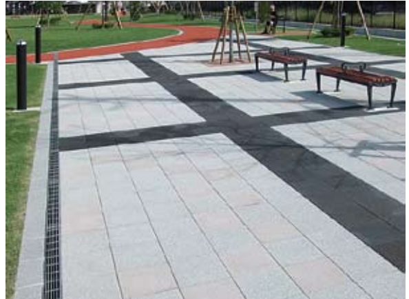
▲鹿児島市「かんまちあ」