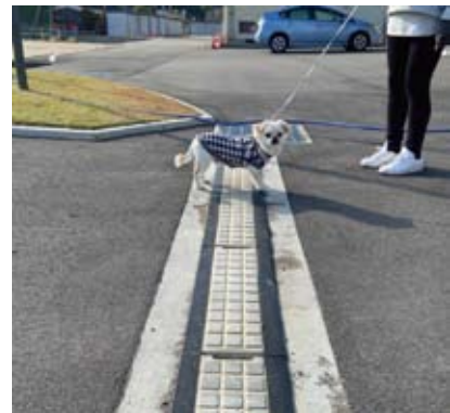
■狭い山道に簡単に待避所が設けられます。 ■狭い住宅街でのすれ違いが容易になります。 ■通学路における児童の安全確保に最適です。