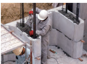
⑤ 縦貫コンクリート打設