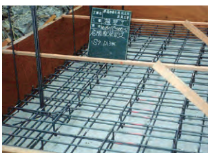
① 底版・縦貫鉄筋配置