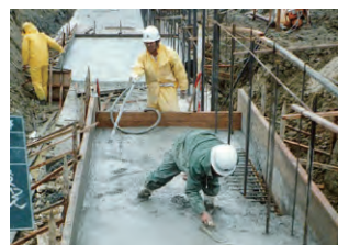
② 基礎コンクリート打設