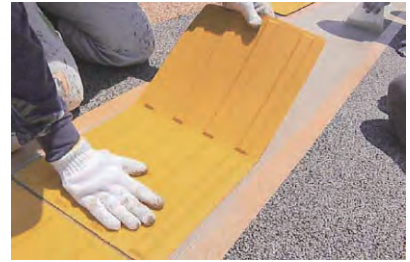
6. 点字タイルの貼付け