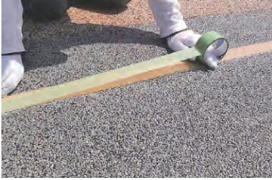
1. 墨出し清掃・マスキングテープ貼り(2重貼り)