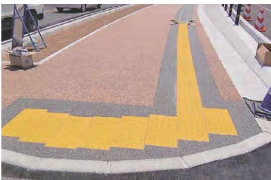
10. 完成(開放) 養生をとり、接着剤硬化を確認の上(冬期約90分 その他の季節約60分)解放します。