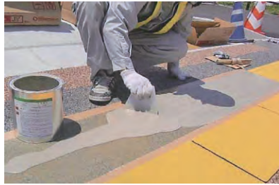
5. 専用接着剤の塗布・上塗り 2.の手順で再度接着剤を混合攪拌し、専用のクシ目ゴテでムラなく均一に塗布します。