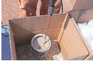
2. 専用接着剤の混合攪拌