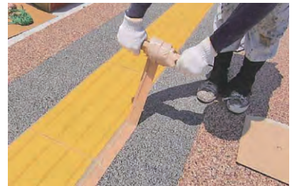
9. マスキングテープの除去 マスキングテープを取り除きます。接着剤が舗装面に垂れないように注意して巻き取ってください。