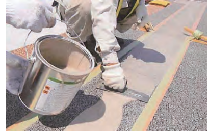
3. 専用接着剤の塗布・下塗り(シゴキ)