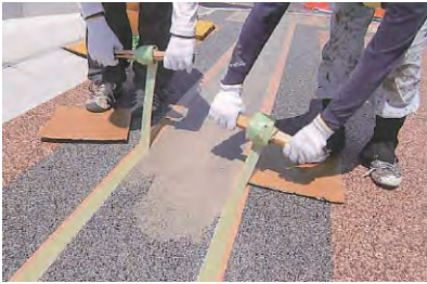
4. マスキングテープ(上部)を除去し養生