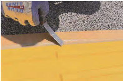
7. 点字タイル端部のテーパ処理