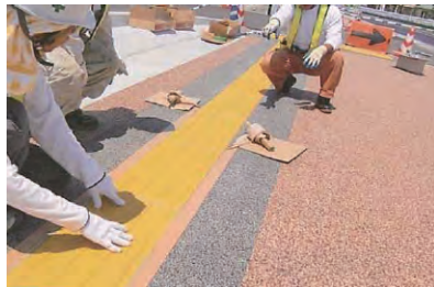
8. 通り(直線性)の確認