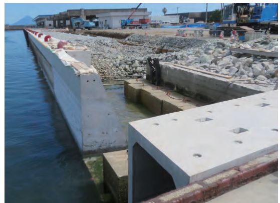
鹿児島県枕崎市:枕崎漁港 ボックスカルバート↑