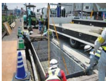
②KCスタンドフォーム据付け