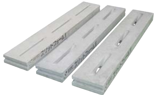
写真左から:細目タイプ、並目タイプ、太目タイプ