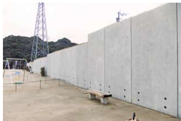
■基礎地盤の必要地耐力(築造仕様書から引用)