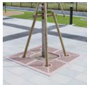
■鹿児島市「かんまちあ」 SQT(正方形・透水)タイプ