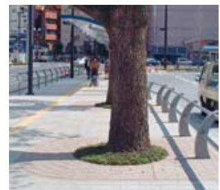
■鹿児島市JR鹿児島中央駅東口 RE(長方形)タイプ