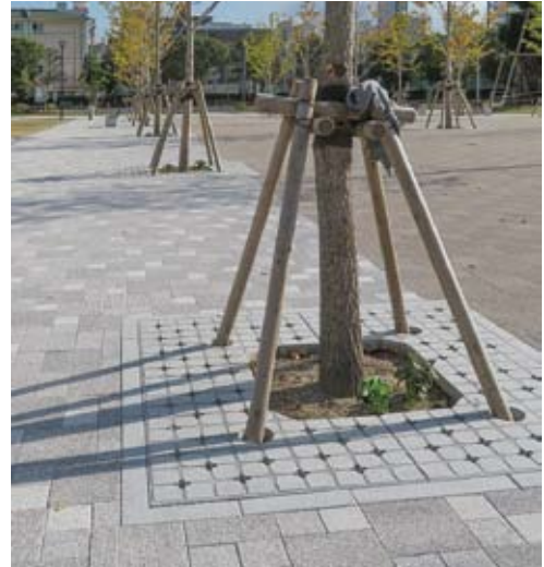
■鹿児島市「加治屋まちの森公園」:SQ(正方形タイプ)

メンテナンスが植栽帯よりも容易なため、管理費のコストダウンが望めます。施工においても、作業時間が大幅に短縮できます。