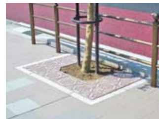
●オーダーパターン 地域、環境に合わせたオリジナルデザインをご提案します。 写真は国道3号鹿児島市伊敷(薩摩切子をモチーフとしています)