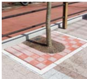
■鹿児島市清滝川 RE(長方形)タイプ