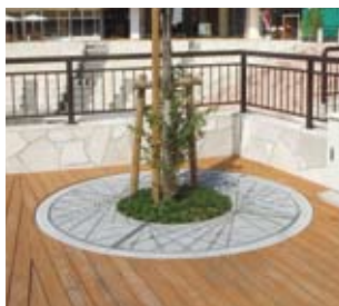
■鹿児島県鹿屋市リナシティ CI(円形)タイプ