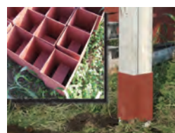
継ぎ手ジョイント