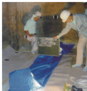
6 リーブシートをセット