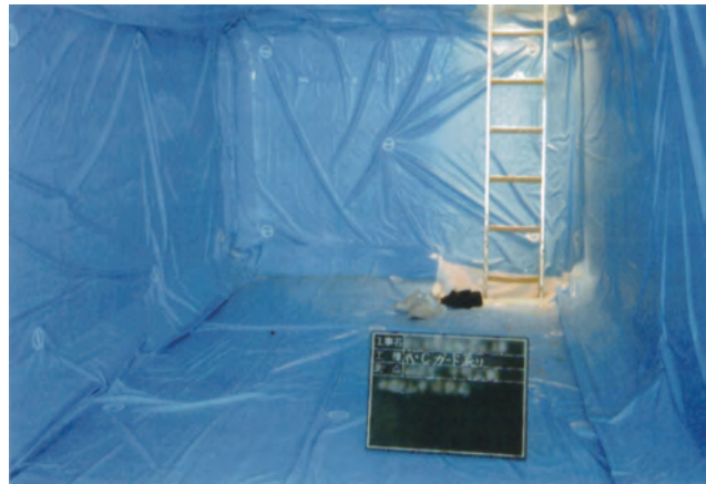
▲「KCガード」セット完了