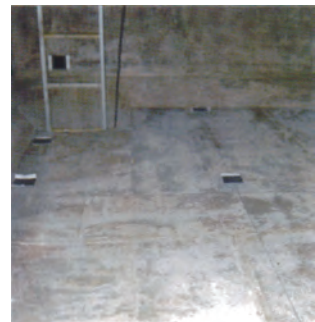
4 面ファスナーセット完了