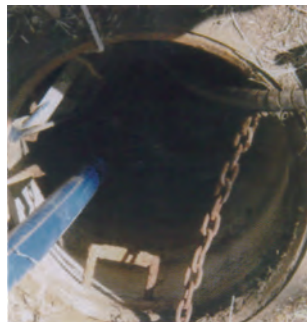
1 水槽内の水の汲み出し

マリンリーブシート工法のシート「KCガード」の素材は、耐候性、耐水性、耐アルカリ性に優れた多層特殊樹脂シートです。地震災害や老朽化などで既設の防火水槽に損傷が発生していてもしっかり水を保持するために生まれました。水槽内壁面の形状に合わせてオーダーメイド製袋しますので、取り付け後は水槽形状と一体化した二重防水構造となり、防水性をより確実なものにしています。