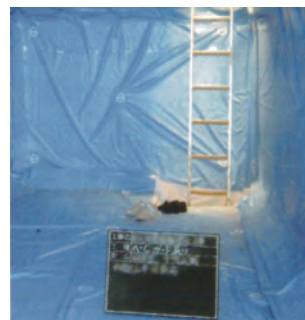
7 リーブシート貼付け完了