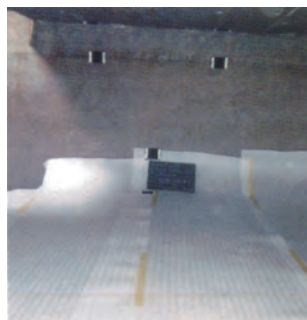
5 緩衝シートを貼付け