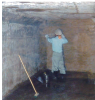
2 清掃及び採寸 藻等が躯体に付着している場合は 高圧水等で洗い流します。