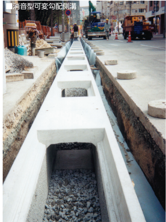
■消音型可変勾配側溝