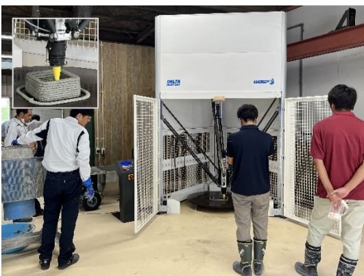
3Dプリンタを利用した開発