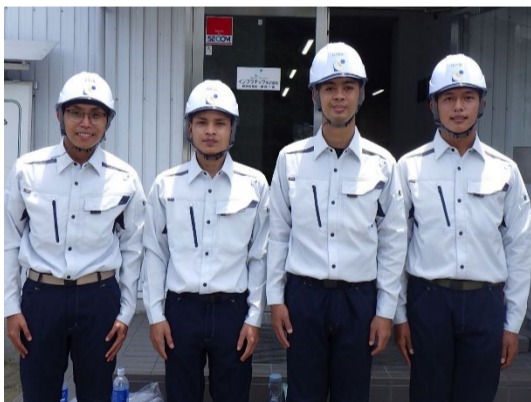
多様性のある人材採用