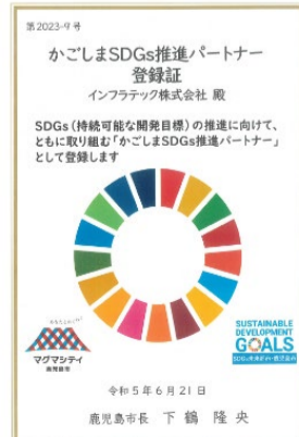
鹿児島市SDGs推進パートナー