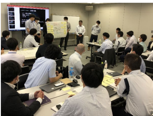
各種営業・技術研修