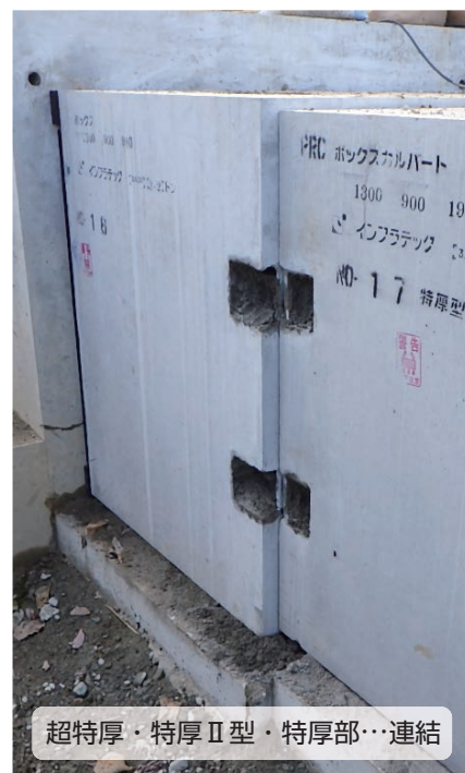
超特厚・特厚Ⅱ型・特厚部…連結